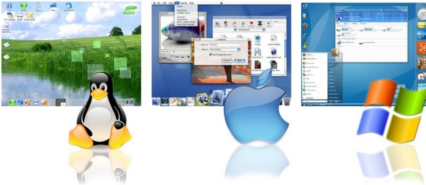
Plocha jednotlivých operačních systémů 2